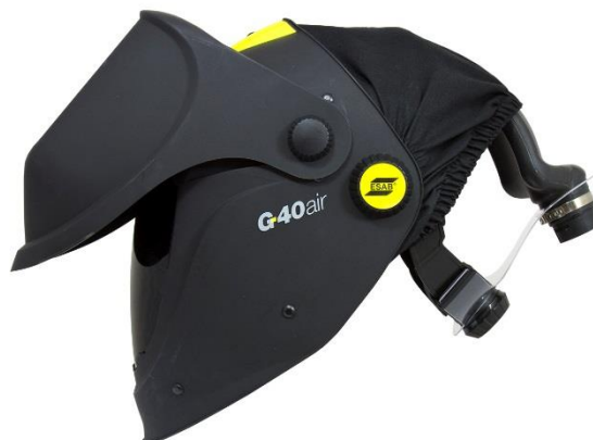
G40/G50 pro Air