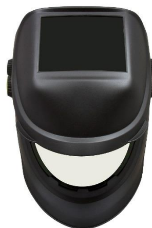
Velký vnitřní průhled